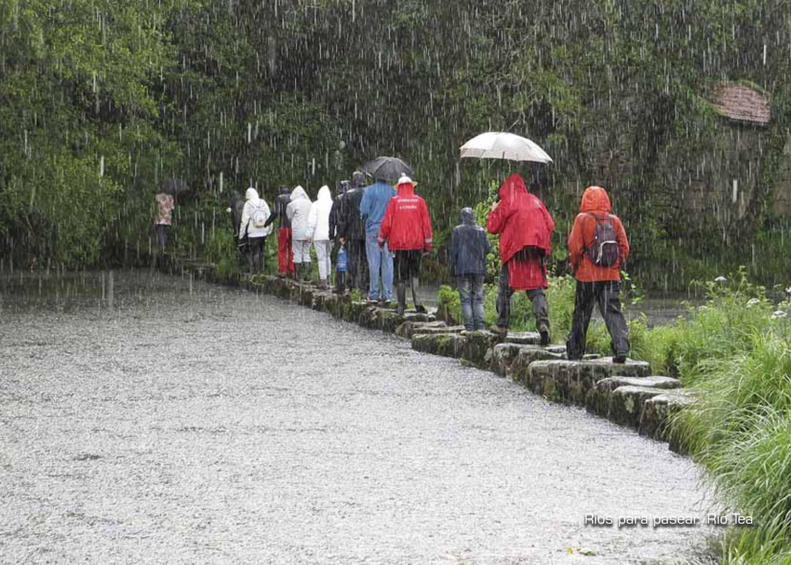
Ríos para pasear: Río Tea